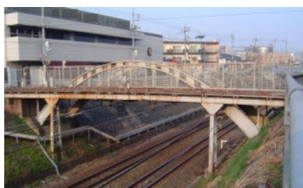
↑ 75年間頑張った、二代目めがね橋