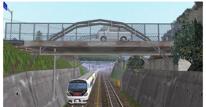
↑ VRM V3でも作ってたりする「めがね橋」 「現代ローカル風景」(レイアウトコンテスト2006出品作)より