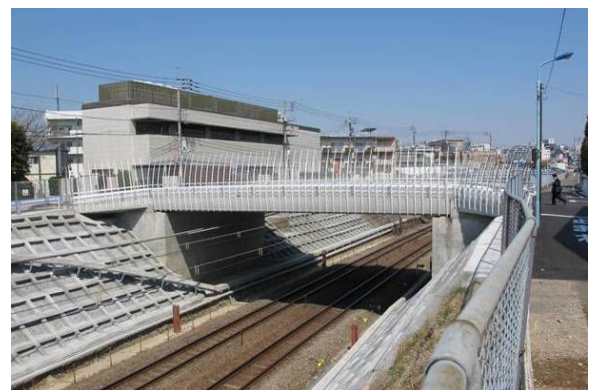
↑ 三代目 めがね橋