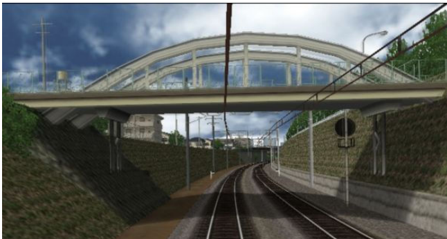
↑ 実は、某電車でGOにも登場していたりする「めがね橋」