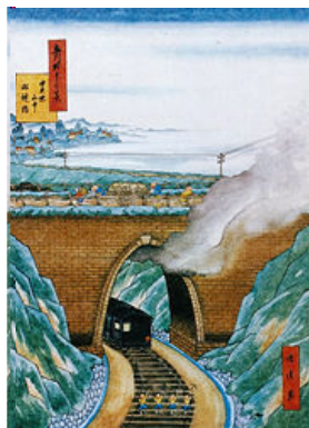
↑ 初代 めがね橋

恐らく、初代橋が煉瓦造りアーチ橋であった故に付いた愛称が、現在まで残っているのでしょう(しかし一連アーチ橋)。