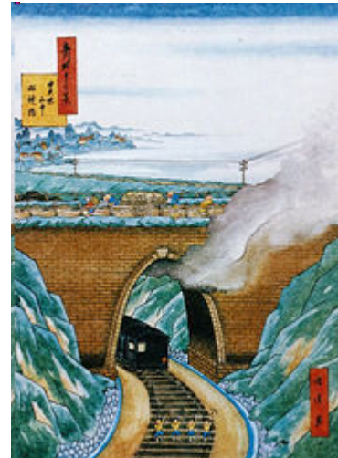
↑ 初代 めがね橋