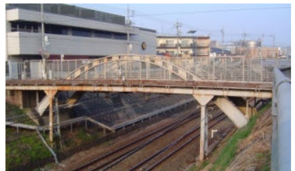
↑ 二代目 めがね橋